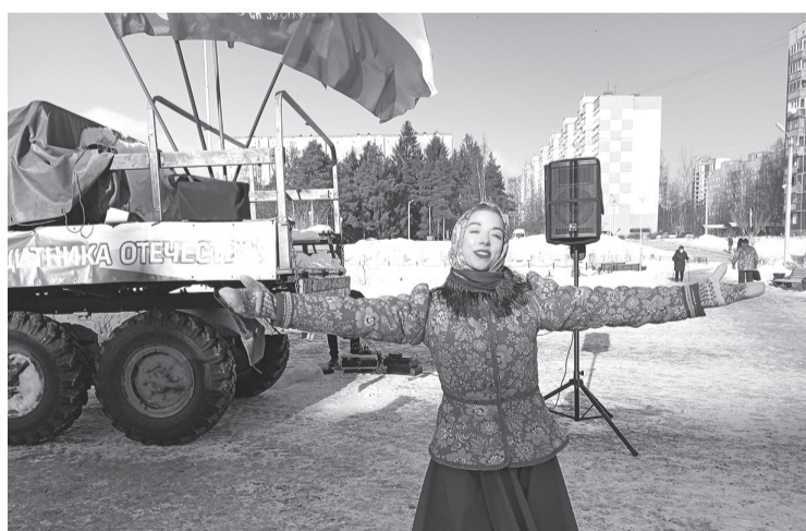
Для настоящего праздника большая сцена не нужна

— Горячий чай артистам! И на сцену! — звучит команда режиссёра, хотя никакой сцены вокруг мы не наблюдаем. Есть только небольшой помост на площади в Парке героев посёлка Сертолово. Вокруг — звуковая аппаратура, пара микрофонов на стойках и стекающиеся на звуки музыки зрители.