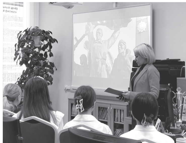
«Разговоры о важном» также посвящают памяти героев Великой Отечественной войны