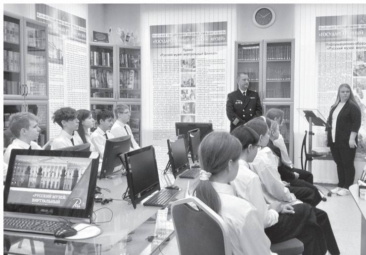
Тематический урок в Кировской гимназии имени Героя Советского Союза Султана Баймагамбетова

В сентябре в российских школах и учреждениях среднего профессионального образования ввели еженедельные «Разговоры о важном». Каждый понедельник теперь начинается с церемонии поднятия государственного флага под звуки российского гимна. Затем — 30-минутный классный час, тема которого обычно связана с важной исторической датой или государственным праздником. Например, уже прошли тематические уроки «День Конституции», «День Героев Отечества», «День матери», «День российской науки», «Прорыв блокады Ленинграда».