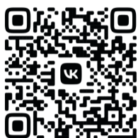
ВидеOVERсия ТК «СвирьИнфо»

Издвеле на Руси «птичка-веснянка» была одним из символов наступающей весны, также её считали хранительницей семейного очага и благополучия.