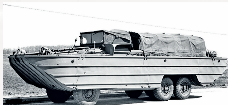
Амфибийное транспортное средство DUKW, поставленное Советам по ленд-лизу из США

огонь. Стреляющие батареи и пулемётные точки сразу же были засечены артиллерийскими наблюдателями, и по ним ударили советские орудия и миномёты. Воины-буксировщики заняли укрытия на противоположном берегу реки буквально в нескольких десятках метров от траншей противника и в течение всей артиллерийской подготовки находились в зоне огня нашей артиллерии. 16 храбрецов, участвовавших в демонстрации переправы, были удостоены звания Героев Советского Союза.