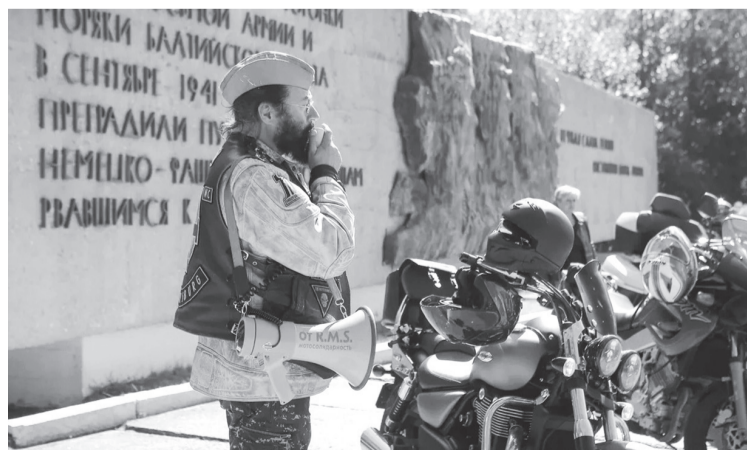
Традиционный мотопробег по местам воинской славы