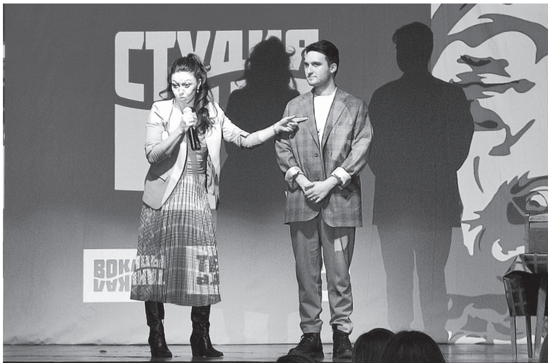
«Студия 47» — новый проект для творческой молодёжи